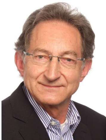
Staufer, Walter Transferdialog 5: Gut überbringen! – Von Leichter Sprache bis Szenesprech

Kontakt: www.sozarb.h-da.de/politische-jugendbildung